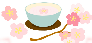
桜茶のふるまい(数に限りあり)